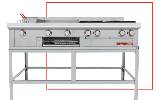
OPCIONAL: Base estructural o Kit de patas tubulares.