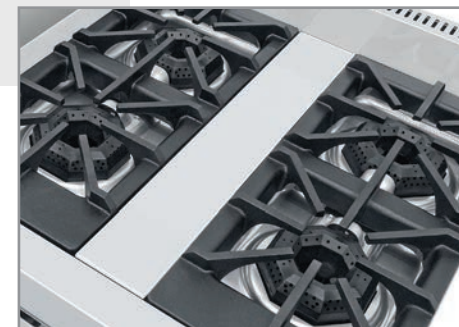
Robustas parrillas súper resistentes desmontables, facilitan la limpieza.