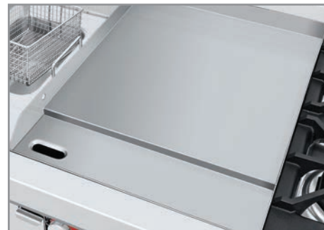
Plancha con exclusivo sistema para recolectar grasa y residuos.