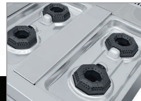
Cubierta semi-sellada que evita escurrimientos al interior.