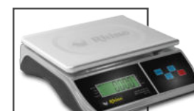
Incluye mica protectora