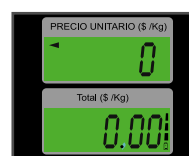
Pantallas de cuarzo con iluminación (backlight)